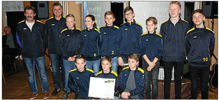
Erfolgreiche Nachwuchskicker. Die D-Junioren des SuS Berumerfehn holten sich den Ostfrieslandpokal.