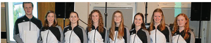
Ostfriesländermeister. Die trainingsfleißigen Voltgierer vertraten erfolgreich die Farben des Reit- und Fahrvereins Westerende.