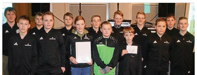
Erfolgreiche Nachwuchsfußballer. Die D-Jugendlichen der SG Großheide/Arle setzten sich an die Spitze.