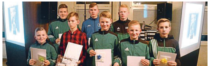
Reichlich Talente. Die Friesensport-Hochburg Großheide gefällt mit vielen Top-Verferrn.